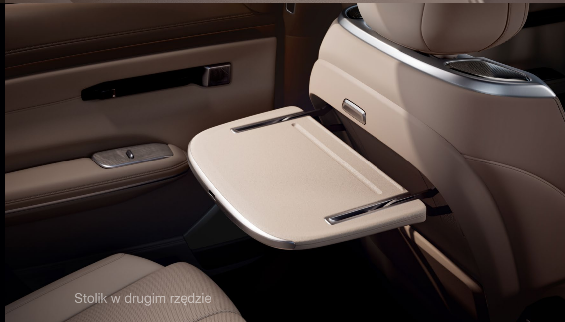
Stolik w drugim rzędzie

Przestrzenny dźwięk i wyjątkowe doznania audio dostarczają 22 głośniki Dolby Atmos®. Wrażenie robi panoramiczny szyberdach, zmieniając każdą podróż w widokową i malowniczą przygodę.