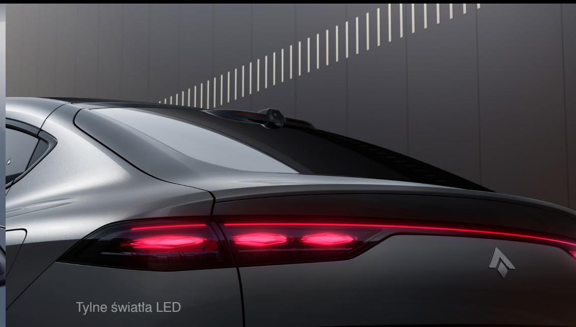
Tylne światła LED