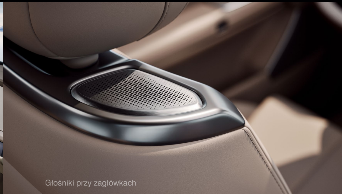
Głośniki przy zagłówkach