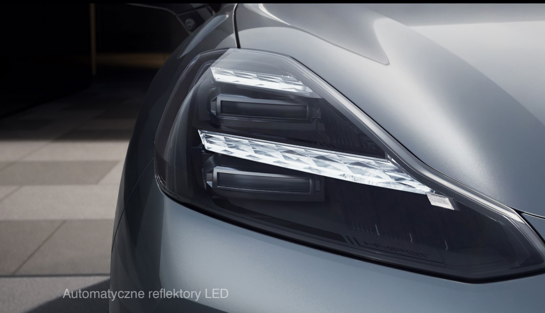
Automatyczne reflektory LED