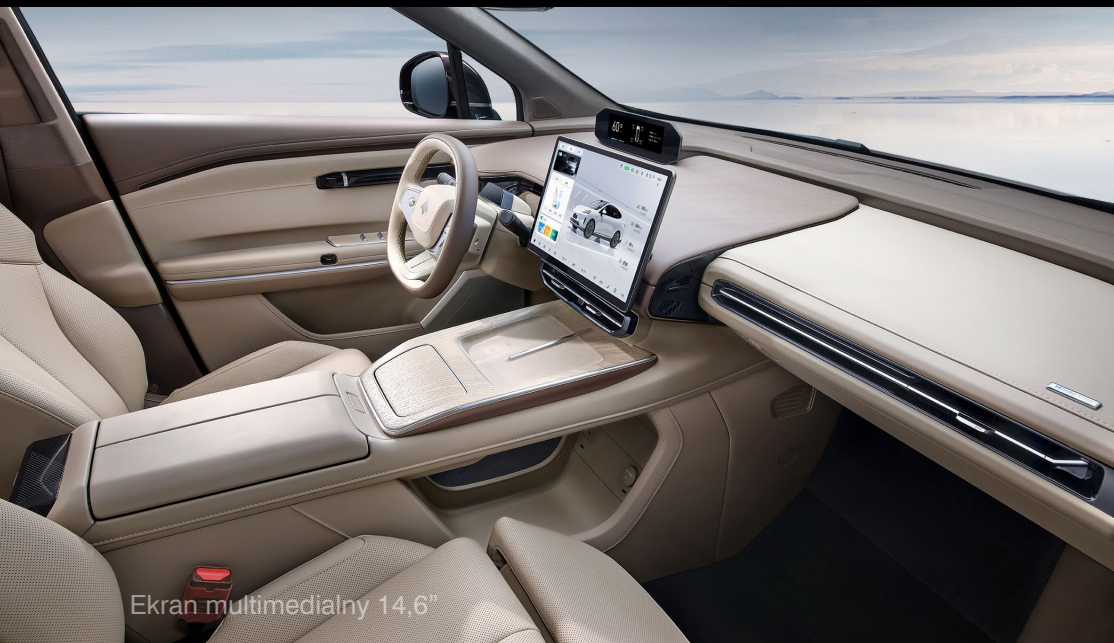
Ekran multimedialny 14,6"