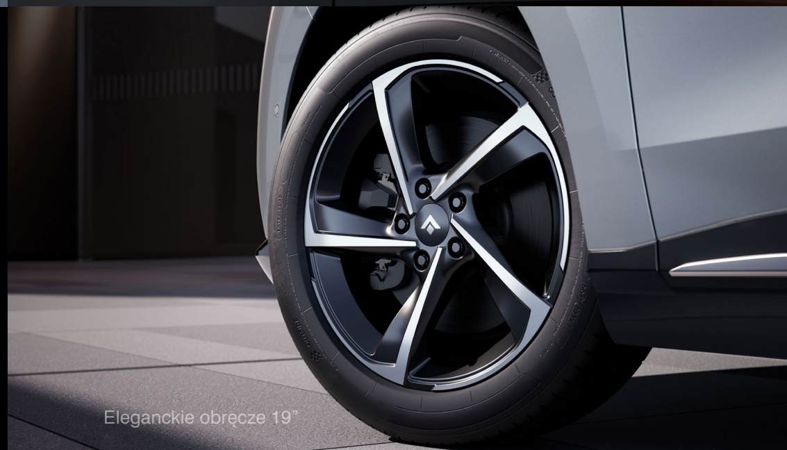
Eleganckie obręcze 19"

Każdy detal Hypec HT został stworzony z myślą o wkomponowaniu się w jego niepowtarzalny styl. Od wysokiej jakości automatycznych reflektorów i świateł LED, po eleganckie obręcze 19", wszystkie te elementy podkreślają ekskluzywność i sportowe zacięcie tego zachwycającego samochodu.