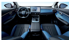
Light Wave Blue